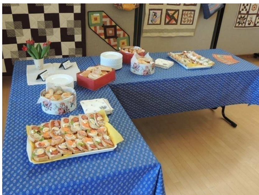
8. kép Felkészülés az állófogadásra