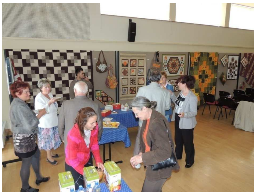
9. kép Állófogadás

mint a megvalósításban alvállalkozóként résztevő együttműködő partner