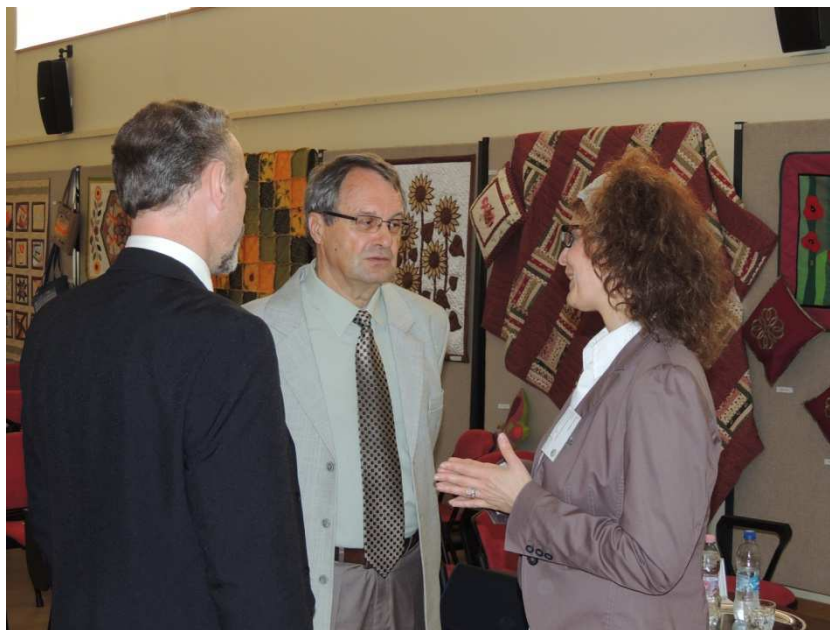
3. kép Előzetes megbeszélés az előadókkal

mint a megvalósításban alvállalkozóként résztevő együttműködő partner