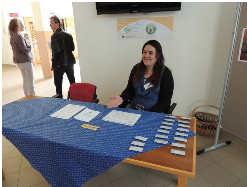
1. kép Vendégek fogadása

mint a megvalósításban alvállalkozóként résztevő együttműködő partner