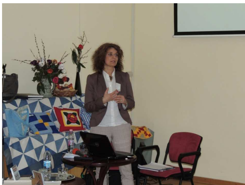
10. kép Zárszó és köszönetnyilvánítás