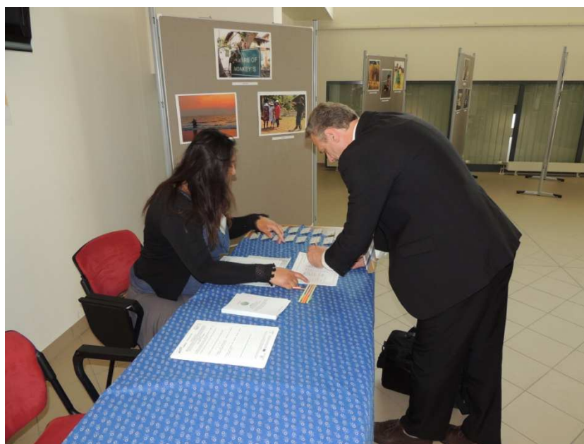
2. kép Regisztráció