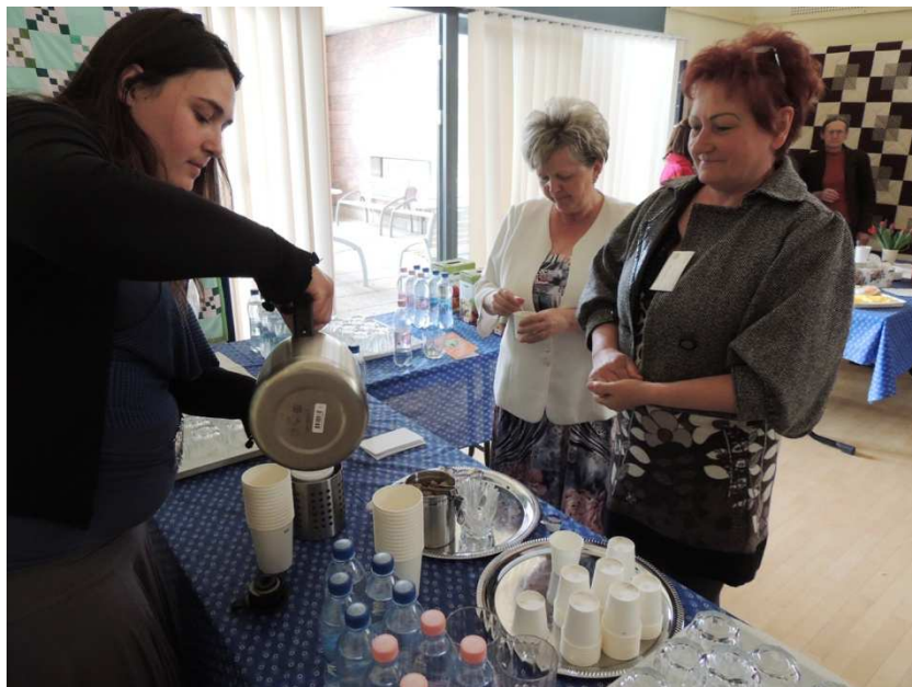
6. kép Kávészünet